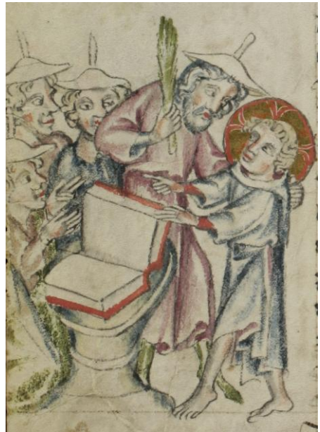
Photo : Jésus se dispute avec son maître sur la nature des lettres (ibid.)

comme tout, mais... quel intérêt ?...), tantôt son éducation et comment il va apprendre à lire, tantôt encore comment il va apprendre à user de son pouvoir pour le bien et non pour le mal (on peut lire dans l' Évangile de l'enfance que Jésus n'utilise pas toujours ses pouvoirs à bon escient, et que Joseph se fâche et le consigne à la maison...), etc.