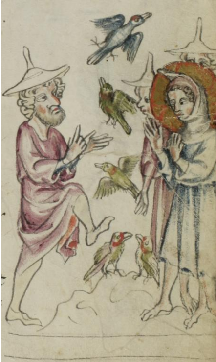
Photo : Jésus fait s'envoler les oiseaux d'argile de ses camarades (Klosterneuburger

En fait, ces textes essaient de combler les « vides » qui dérangent, et racontent tantôt des miracles réalisés par Jésus enfant (ainsi, dans l' Évangile selon