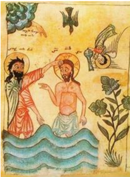
Le Baptême du Christ – Evangélique arménien

Jésus vient de recevoir le baptême par Jean dans les eaux du Jourdain (Lc 1, 21-22).