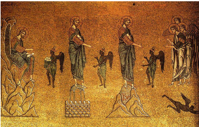
Jésus tenté au désert Mosaïque Basilique St Marc Venise – XII ème s.

Mais n'allons pas trop vite : nous y reviendrons dans