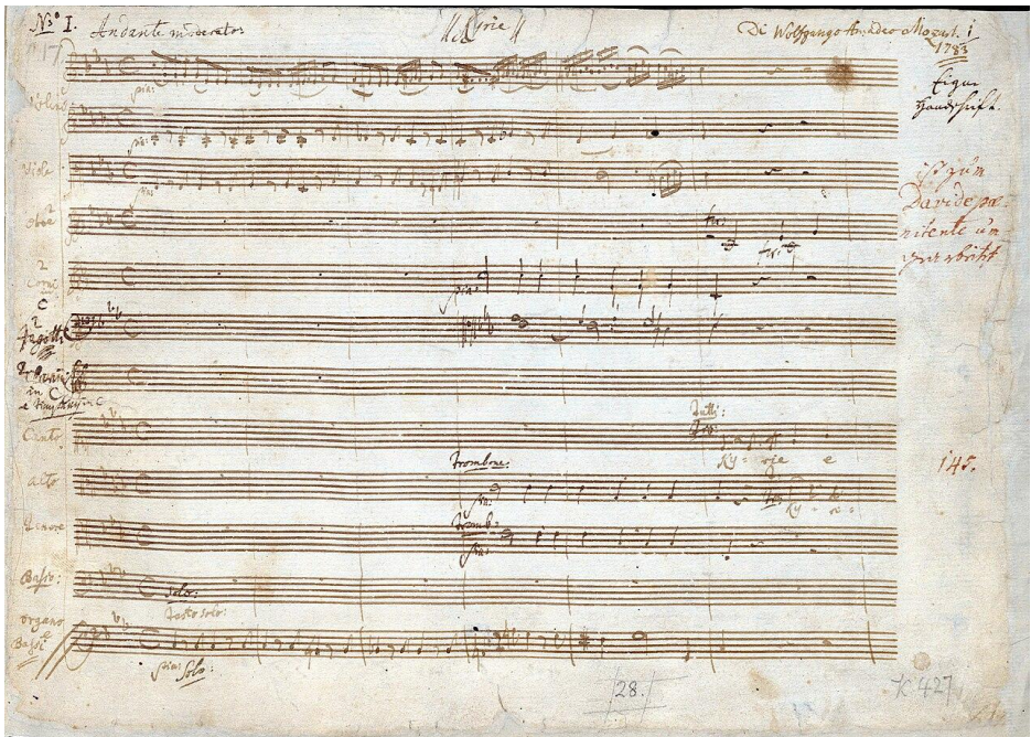
Autographe du Kyrie (recto)

Influences musicales : Même si Mozart écrivait des opéras et des symphonies à succès pendant cette période (par exemple, Die Entführung aus dem Serail avait été créé en 1782), il s'immergeait aussi dans l'étude des maîtres baroques. À Vienne, il avait rejoint le cercle du baron Gottfried van Swieten, qui lui fit découvrir la musique de J. S. Bach et Haendel . Cette étude imprima une forte marque à la Messe en ut mineur. Mozart écrivit même à sa sœur que Constanze "absolument tomba amoureuse" des fugues de Bach et Haendel qu'il rapportait de la bibliothèque de van Swieten. Ainsi, la messe devint une sorte d'exutoire créatif où Mozart mêla les techniques contrapuntiques baroques au style classique de son temps.