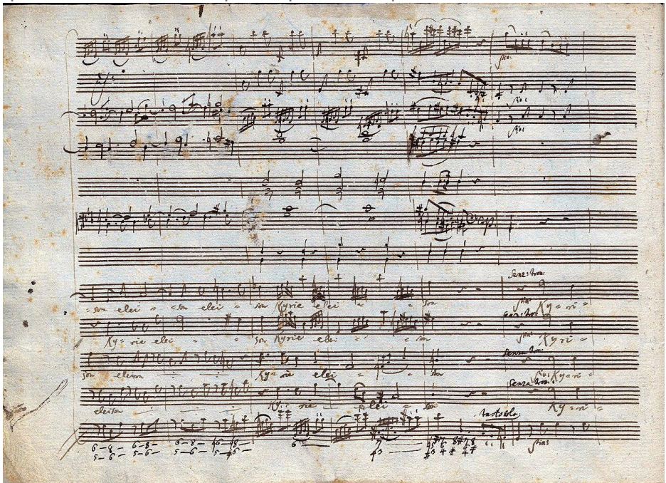
Autographe du Kyrie (4 ème page)

Mozart a orchestré la Messe en ut mineur pour de grands effectifs. L'œuvre requiert un double chœur SATB et quatre solistes vocaux (deux sopranos, un ténor et une basse). L'usage de deux sopranos solistes est notable – il permet à Mozart d'écrire deux parties de soprano distinctes (souvent l'une prenant des airs de colorature et l'autre rejoignant des ensembles ou des duos) et aussi de disposer d'un quatuor de solistes complet à quatre voix pour le Benedictus .