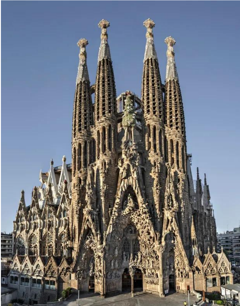
Sagrada Familia

UNE CATÉCHÈSE EN PIERRE : LES TROIS LANGAGES DE LA SAGRADA FAMÍLIA