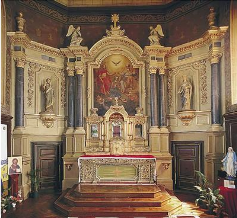
MAÎTRE-AUTEL ET RETABLE DE LA CHAPELLE DES BÉNÉDICTINES MARBRE, BOIS PEINT ET DORÉ, HUILE SUR TOILE XVIIIÈ SIÈCLE - XVIIIÈ SIÈCLE, VITRÉ, FRANCE

de Meaux, définit l'Élévation dans son dictionnaire : « Ce mot signifie aussi des Motets à 1, 2, 3, 4 voix. Ordinairement seules, quelquefois avec des violons ou des flûtes, presque toujours avec une basse continue, qu'on chante pendant qu'on lève le corps de Notre Seigneur à la messe, d'où l'on a formé ce nom ».