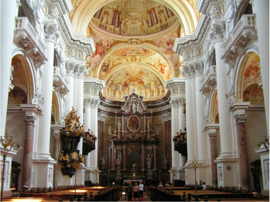
LE MONASTÈRE BAROQUE DE SAINT-FLORIAN (AUTRICHE)