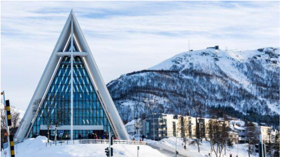
Cathédrale de Tromsø, Norvège.

Au cœur des terres glacées de Norvège, là où le soleil disparaît plusieurs mois durant, une cathédrale se dresse comme une flamme obstinée. Elle est surnommée la “cathédrale arctique” en raison de son emplacement exceptionnel, Tromsø, l’une des villes les plus lointaines au nord de l’Europe, bien au-delà du Cercle polaire. Érigée dans les années 1960 et rattachée à l’Église de Norvège (luthérienne), la cathédrale témoigne depuis plus d’un demi-siècle de la présence vivante de la foi au bout du monde.