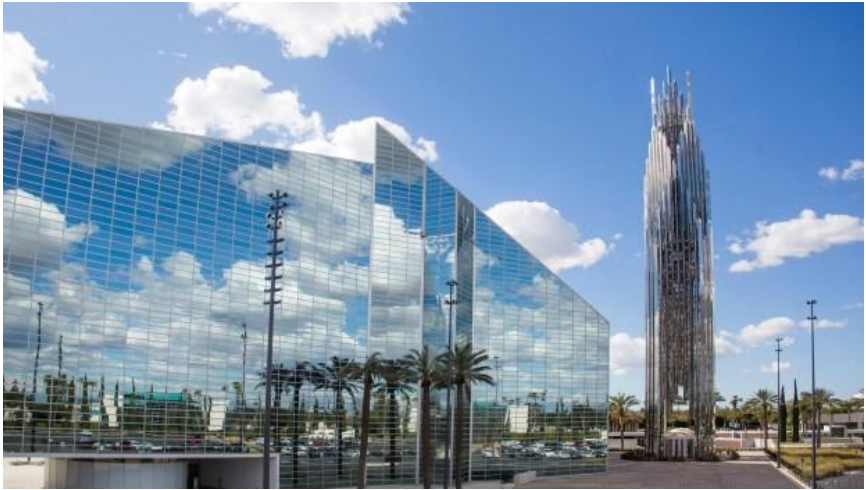
Roman Catholic Diocese of Orange

EN CALIFORNIE, UNE ÉTONNANTE CATHÉDRALE DE CRISTAL POUR LA GLOIRE DE DIEU