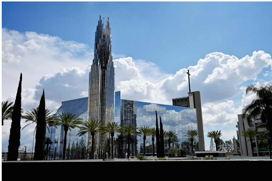
Clocher de la cathédrale.