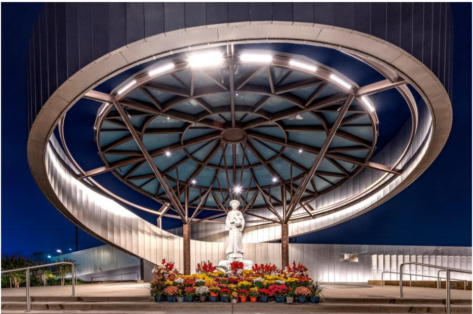
Sanctuaire Notre-Dame de la Vang (1/3)

Chaque semaine, des messes en plusieurs langues (vietnamien, chinois, espagnol...) y sont célébrées. Très prisé des touristes, d'autant plus qu'il est situé à proximité du parc Disneyland, le lieu attire quelque