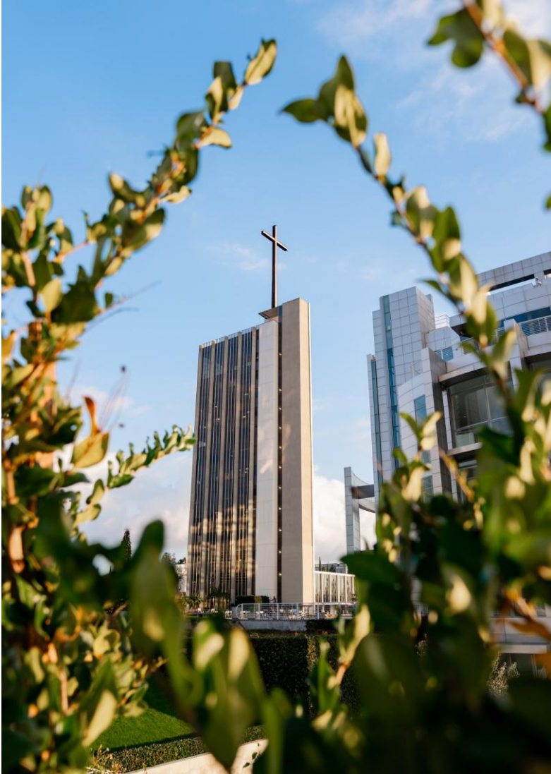
La tour de l'Espérance ("Tower of hope") © Roman Catholic Diocese of Orange