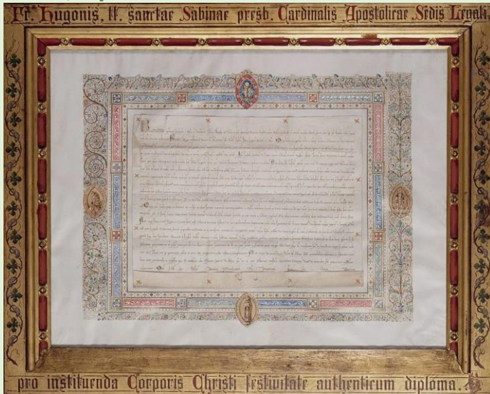
Diplôme d'institution de la Fête-Dieu. Document sur parchemin, 29 décembre 1252 (Grand Curtius, Liège)

L'année suivante, en 1264, le pape Urbain IV, ancien archidiacre de Liège, décida d'étendre la fête à l'Eglise universelle. A la demande du pape, l'Office romain du Saint-Sacrement fut rédigé par S. Thomas d'Aquin, théologien de l'eucharistie très réputé. C'est cet Office qui s'est répandu dans tous les pays et qu'on trouve dans le Missel et dans l'Office romains, aujourd'hui encore.