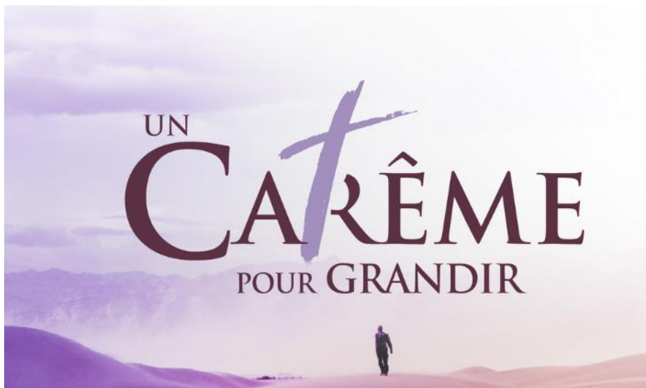
ILLUSTRATION : DIOCÈSE DE REIMS ET DES ARDENNES