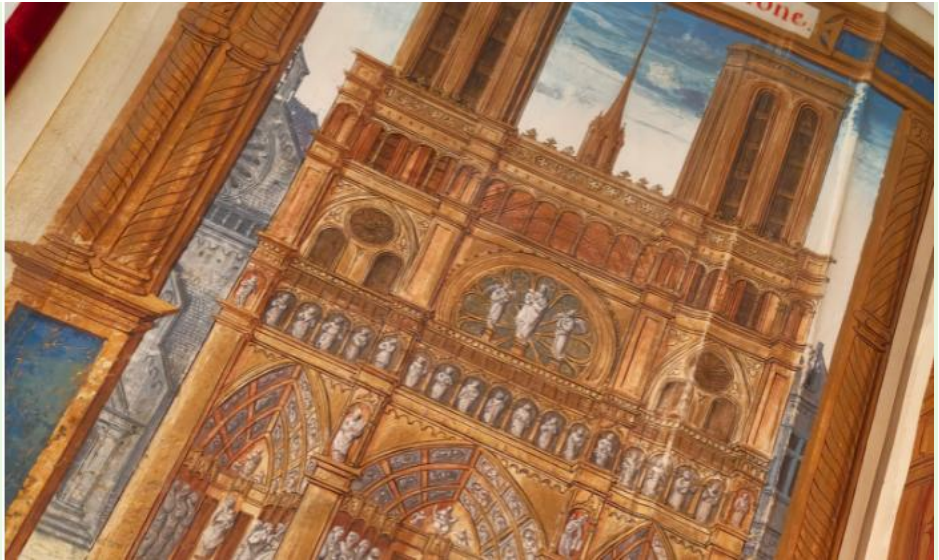
Chefs-d'œuvre de la bibliothèque médiévale - Feuilleter Notre-Dame (c) Agence Le Menu, musée de Cluny - musée national du Moyen Âge

Le parcours rassemble une quarantaine de pièces, dont une trentaine de manuscrits médiévaux conservés au département des manuscrits et à la bibliothèque de l' Arsenal (BnF) et une dizaine de manuscrits, registres capitulaires et plan conservés dans d'autres institutions (Archives nationales, Archives historiques de l'archevêché).