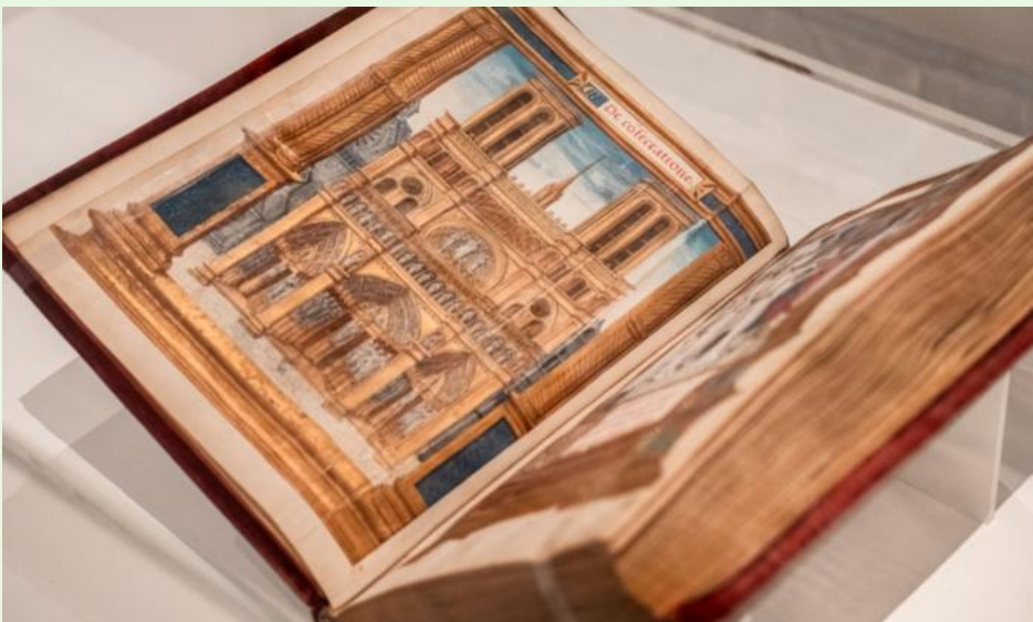
Chefs-d'œuvre de la bibliothèque médiévale Feuilleter Notre-Dame