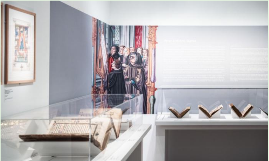
Chefs-d'œuvre de la bibliothèque médiévale Feuilleter Notre-Dame

Elle met également en valeur le rôle clé joué par le chapitre cathédral dans la gestion des livres et de la bibliothèque.