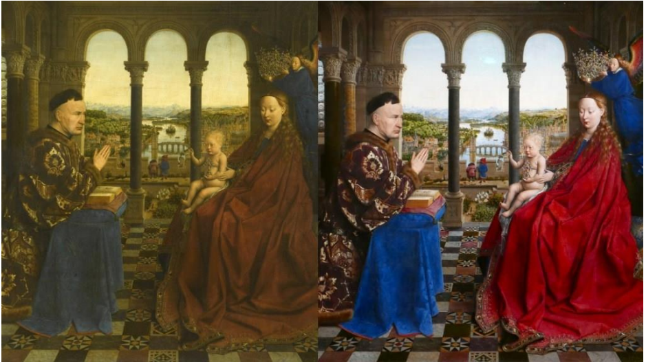
La Vierge du chancelier Rolin avant et après restauration

que sa lointaine cousine la Joconde . Il a fallu attendre plus de 200 ans pour que la Vierge du chancelier Rolin de Jan van Eyck retrouve sa superbe. Désencrassée de ses couches de vernis jauni et oxydé, c'est un tableau éblouissant et parfaitement restauré que le musée du Louvre présente dans l'exposition qui lui est dédiée, « Revoir Van Eyck ». C'est la première fois, depuis son entrée au musée en 1800, que le tableau est restauré.