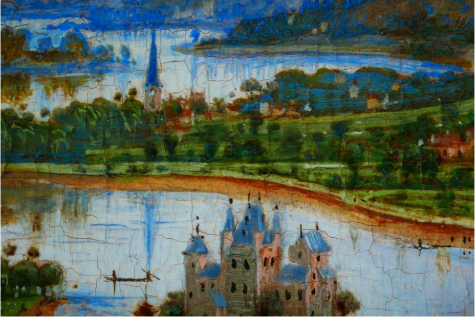
La Vierge du chancelier Rolin (détail) Aleteia