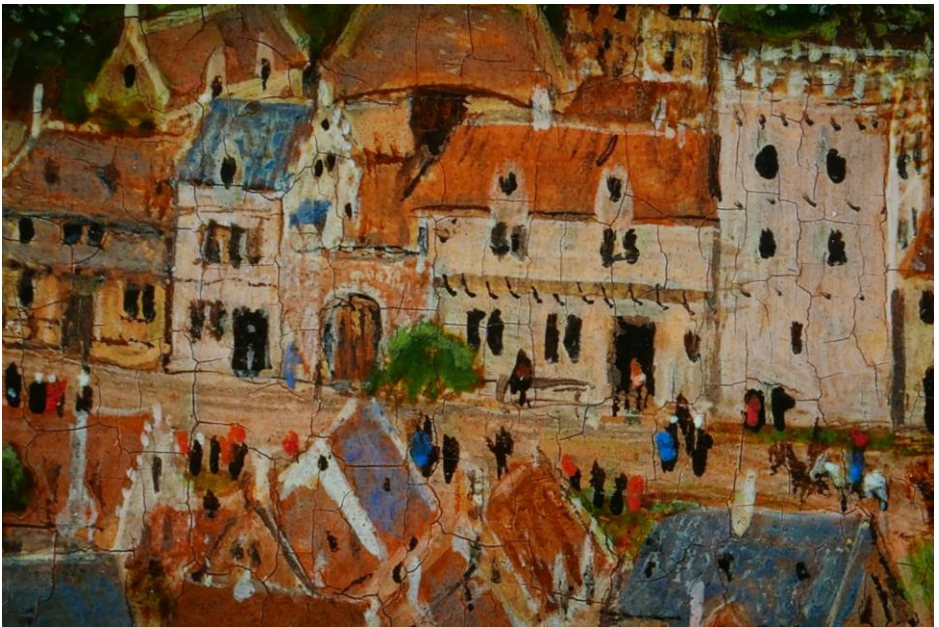
La Vierge du chancelier Rolin (détail)

De l'infiniment grand à l'infiniment petit