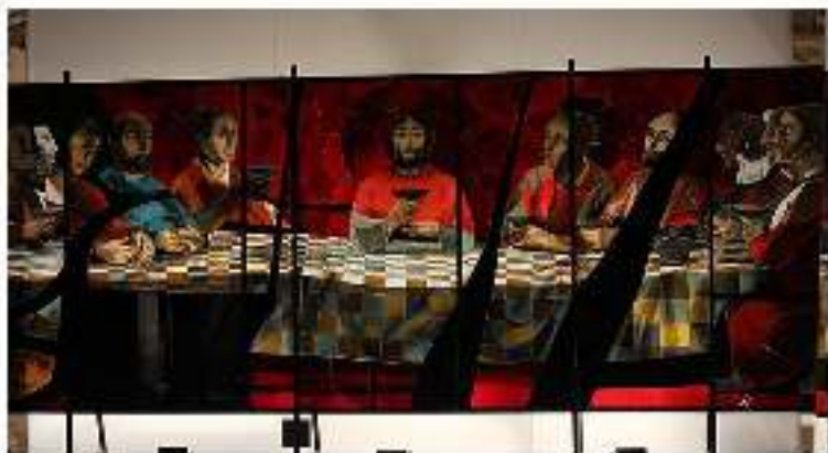
Illustration : Arcabas, La Cène (vitrail), Eglise Notre-Dame des Neiges, Alpe-Duez

Première lettre de St Paul apôtre aux Corinthiens 11, 23-26